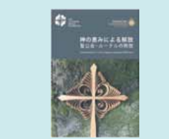
神の恵みによる解放 『聖公会ルーテルの黙想』 日本聖公会・JELCエキュメニズム委員会 2018年5月20日(聖書編纂)刊行