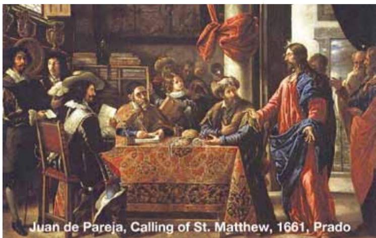
Juan de Pareja, Calling of St. Matthew, 1661, Prado

ルカ福音書に「ザアカイ」という人がいた。この人は徴税人の頭で、金持ちであった(ルカ19:2)とあるように、徴税人の中にも序列があったようです。定められた金額以上を集めれば、余剰を懐に入れることができたため、徴税人の頭は金持